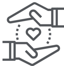
Respeto por las personas