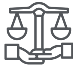
Transparencia y ética